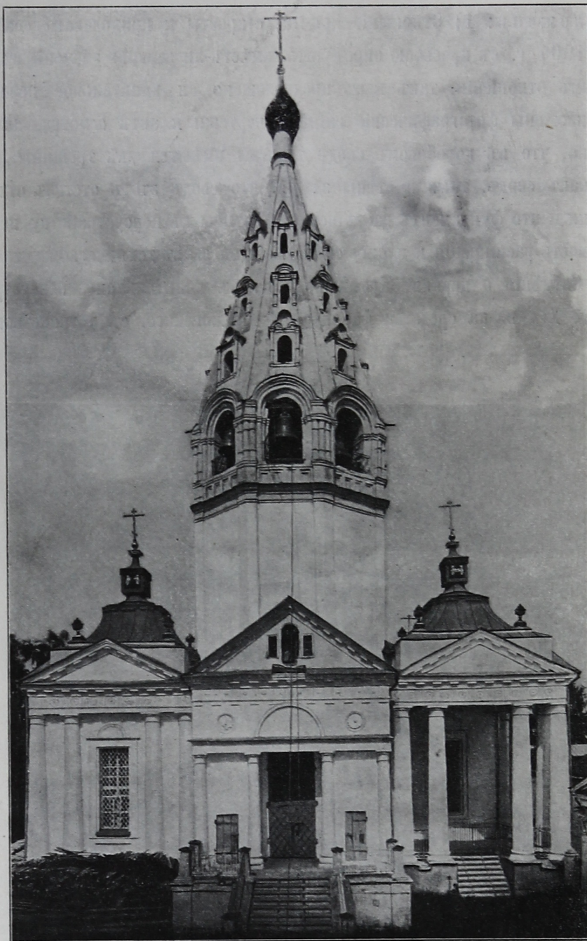
Рис. 7. Колокольня Покровскаго собора въ г. Иваново-Вознесенскѣ.

пезы и портиковъ. Колокольня до этихъ передѣлокъ стояла отдѣльно. Въ церкви имѣется чудотворная икона Казанской Божіей Матери, приложенная князьями