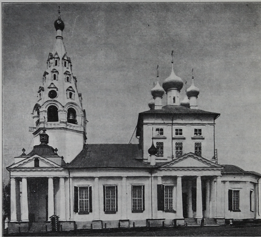
Рис. 5. Покровскій соборъ въ г. Иваново-Вознесенскѣ, 1693 г. Видъ съ юга.