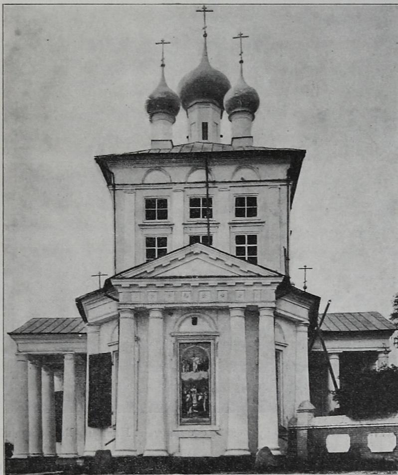
Рис. 6. Покровскій соборъ въ г. Иваново-Вознесенскѣ. Видъ съ востока.

2) Свѣдѣнія о церкви. Храмъ подвергнутъ капитальному переустройству въ началѣ XIX в. на средства фабриканта Мшановскаго, съ устройствомъ тра-