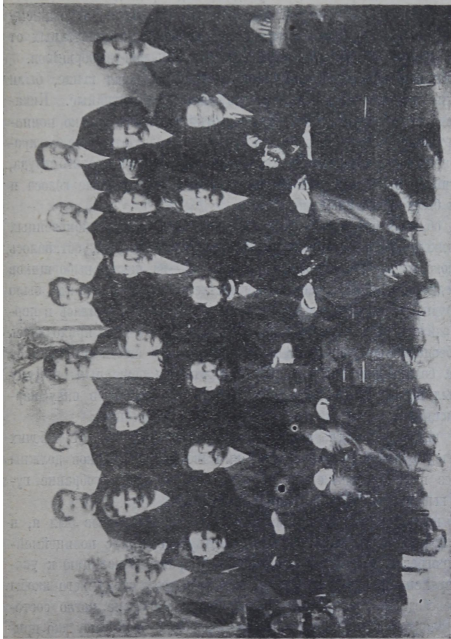
Группа уполномоченных по выборам в 3-ю Гос. Думу от рабочих фабрик и заводов гор. Иваново-Вознесенска среди них:

Пристав был в помещении, а полицейские стояли за дверями, хотя по тогдашнему закону на разрешенных предвыборных собраниях полиция присутствовать не имела права. Тем не менее, пристав не только