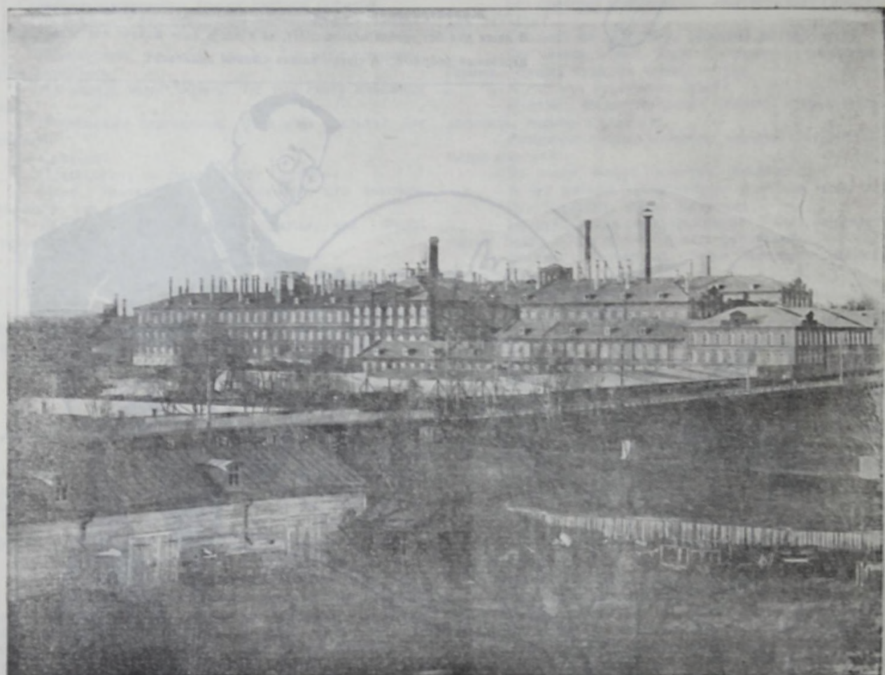
Вид на фабрику с Покровской горы.

Большая Иваново-Вознесенская Мануфактура.