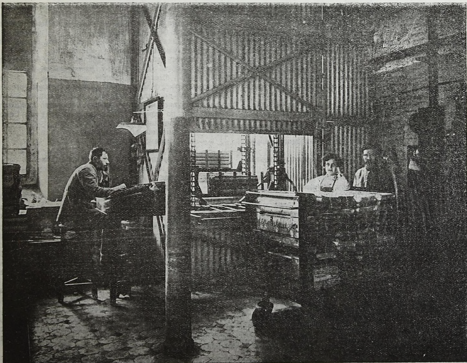
Берет миткаль, выдает нарядные ситца.