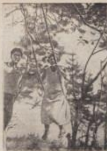
Копка в саду — отдых и работа.