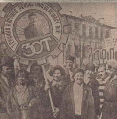
Фото с Первомайской демонстрации 1934 года; в середине новый фонтан, сооруженный к празднику на пл. у Горсовета