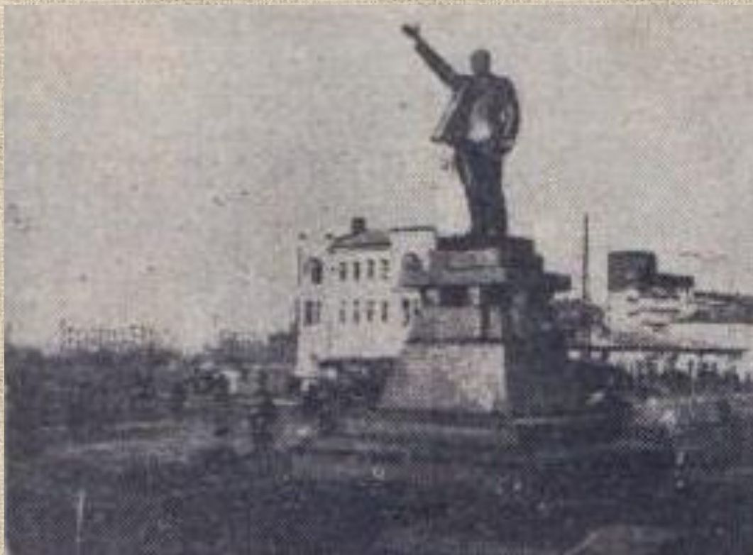
Памятник Ленину в Иваново