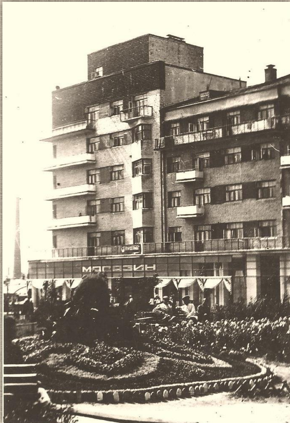
Дом «Корабль». 1937 г. / Изд-во Ивановского кооперативного товарищества «Художник». Фото из открытого доступа (Ивановский музей камня)