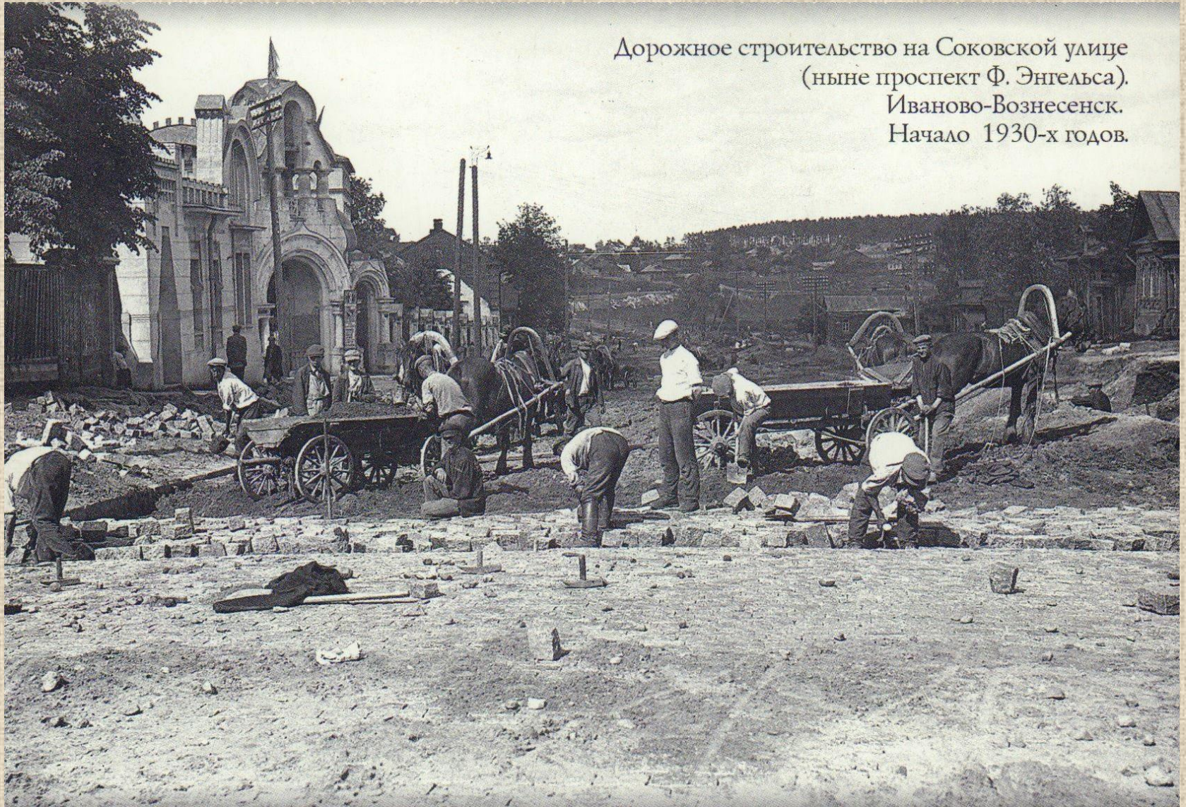
Дорожное строительство на Соковской улице (ныне проспект Ф. Энгельса). Иваново-Вознесенск. Начало 1930-х годов.