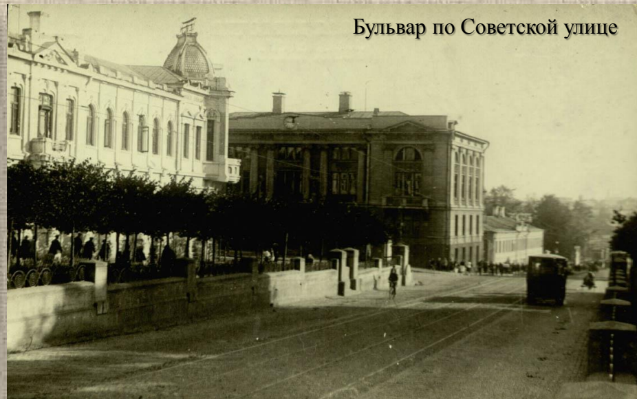
Бульвар по Советской улице