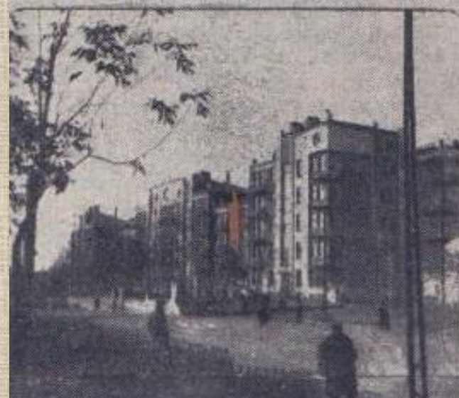
Новые дома в Иваново