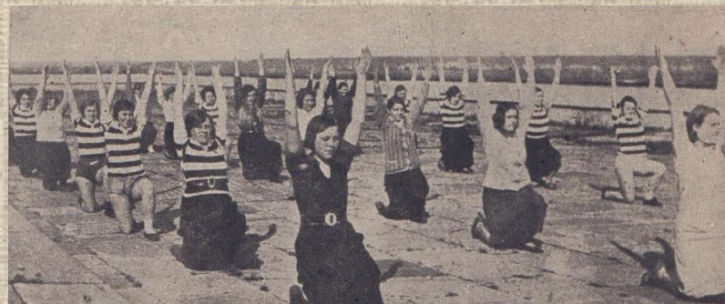
Развернулись оздоровительные работы. Комсомольцы ф-ки им. Дзержинского используют для физкультурных занятий крышу фабричного корпуса