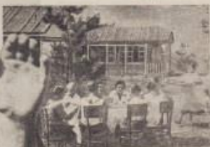
Утренний завтрак на террасе.