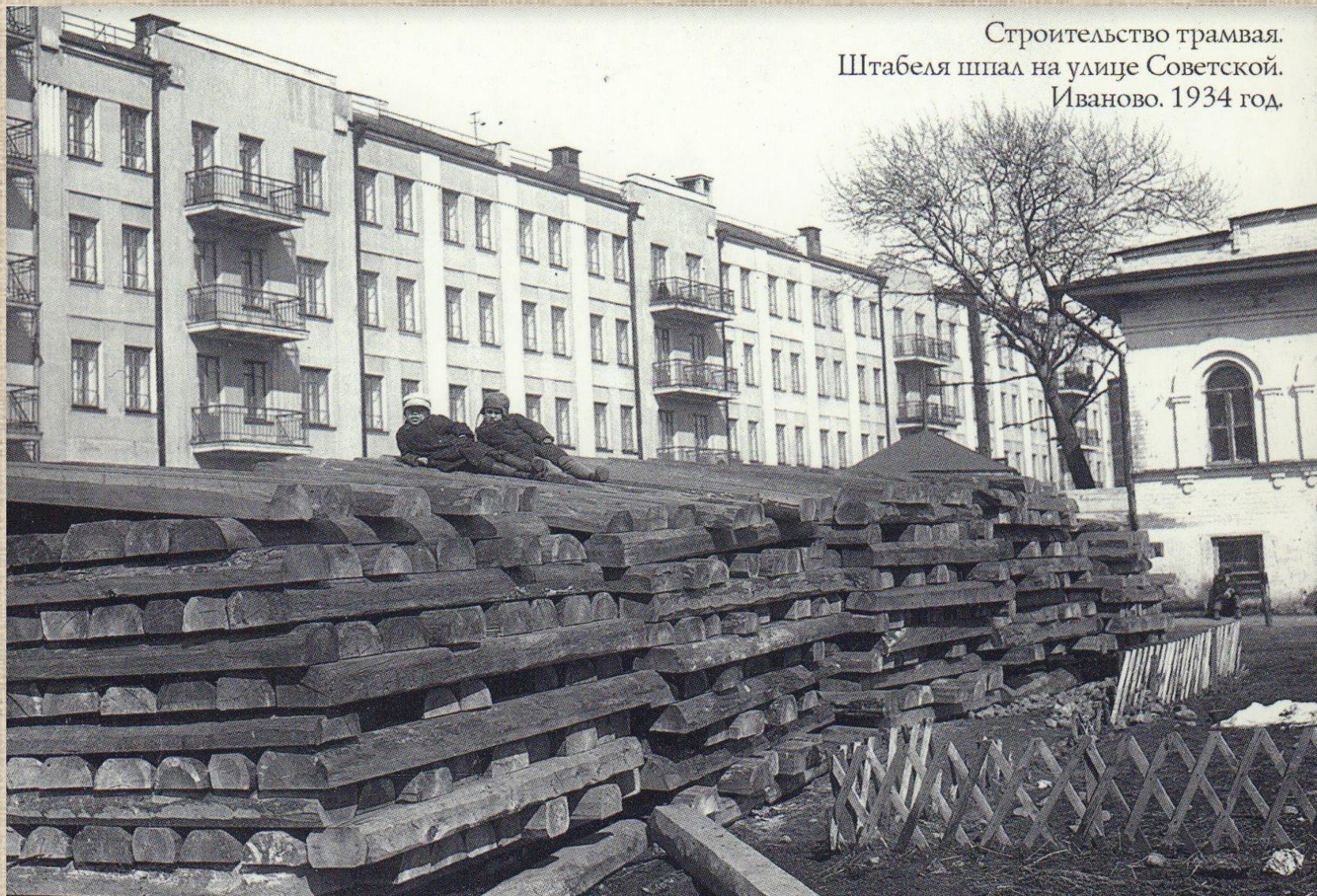
Строительство трамвая. Штабеля шпал на улице Советской. Иваново. 1934 год.