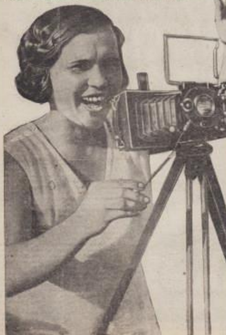
... Главная задача фотоочерка — показать жизнь и труд рабочих. Поэтому фотограф должен быть внимательным и наблюдательным.