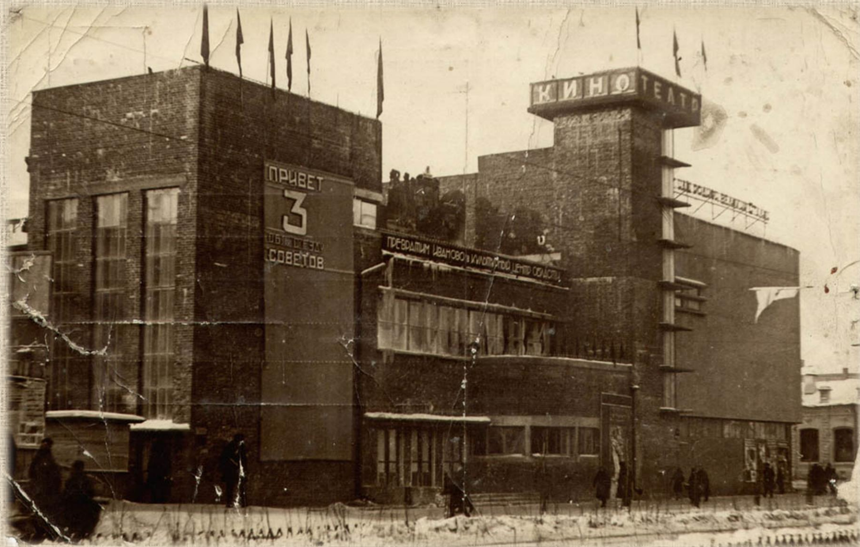
Кино-театр «Центральный». 1937 г. Издательство Ивановского кооперативного товарищества «Художник».