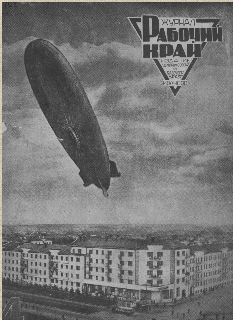
Дирижабль В – 3 над Иваново // Рабочий край [журнал] : Издание Профоблсовета и «Рабочего края». – Иваново, 1931. – № 4. – обл.