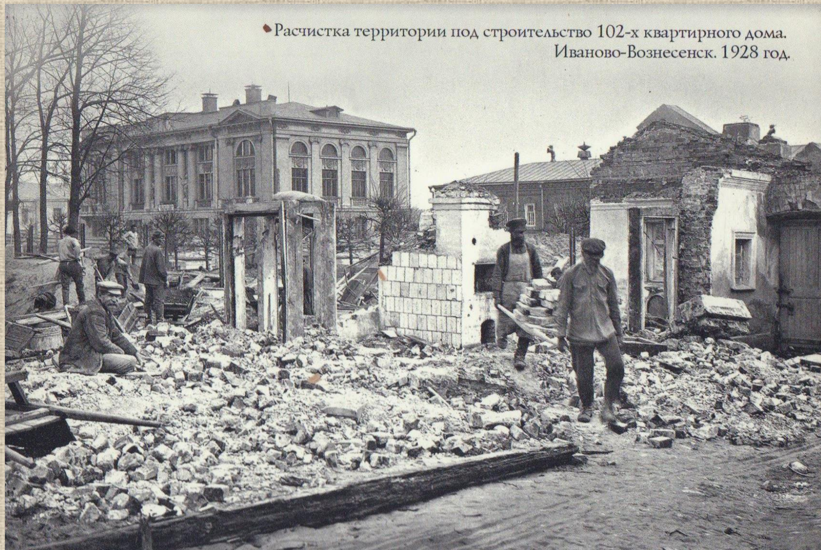
◆ Расчистка территории под строительство 102-х квартирного дома. Иваново-Вознесенск. 1928 год.