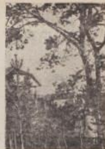
Легко курортный дух развлечений и приключений.