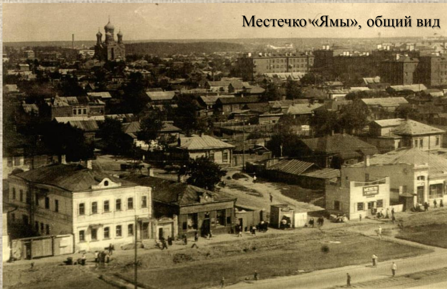
Местечко «Ямы», общий вид