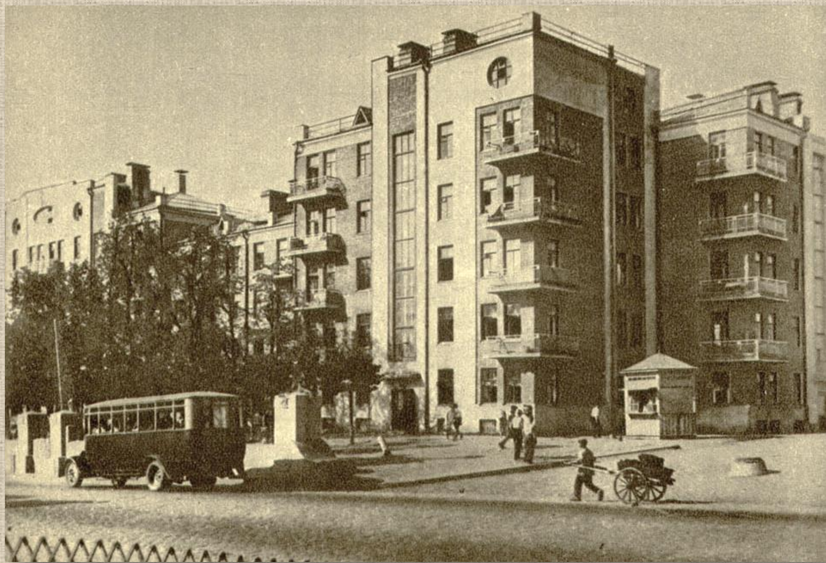
Новый рабочий дом на 102 квартиры. Ок. 1931 г. / Издательство ИЗОГИЗ.