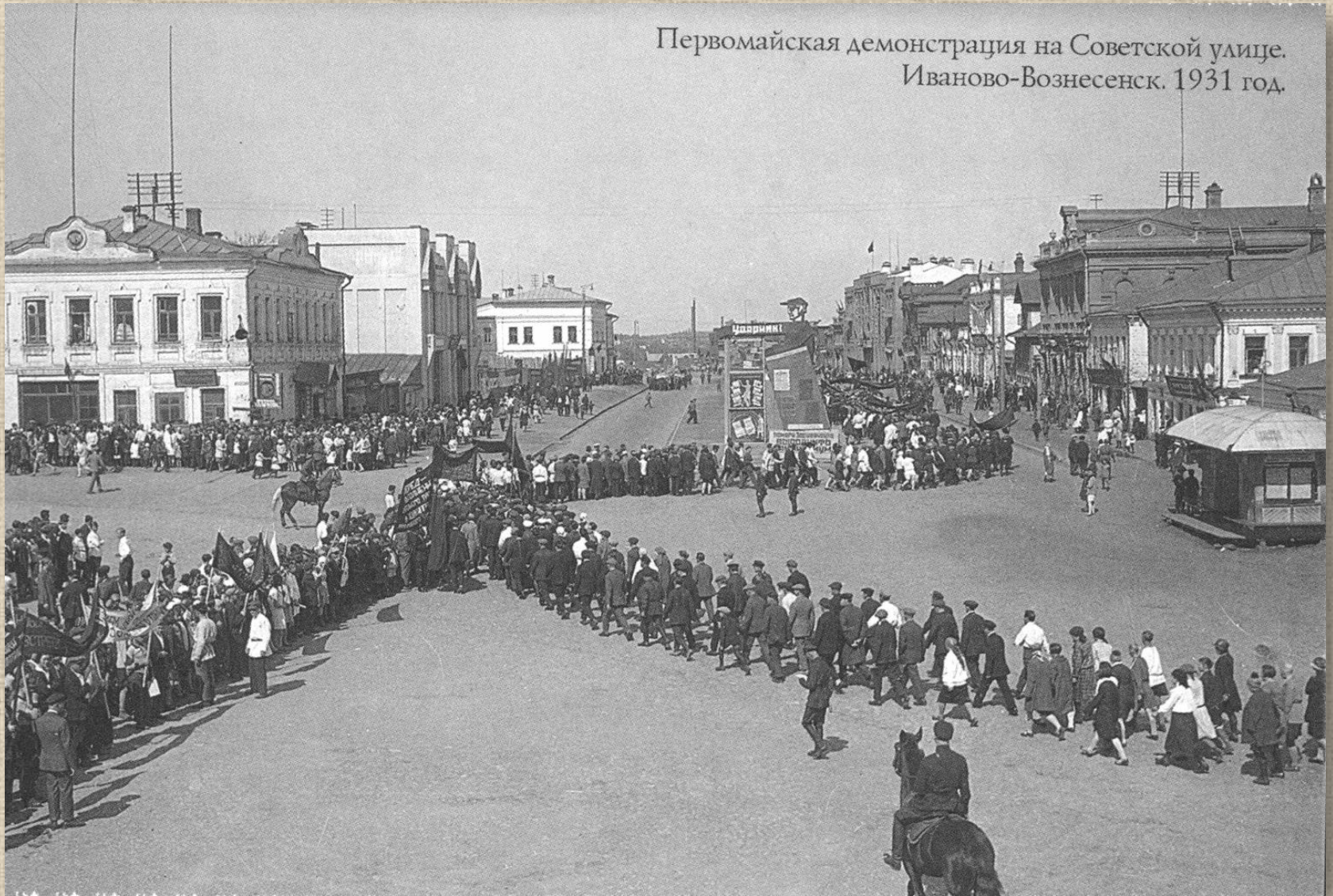
Первомайская демонстрация на Советской улице. Иваново-Вознесенск. 1931 год.