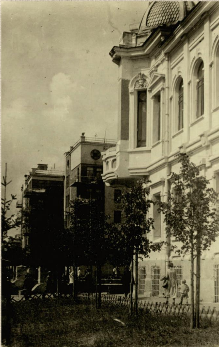
Горком ВКП(б), угол Советской и Батуринской улиц