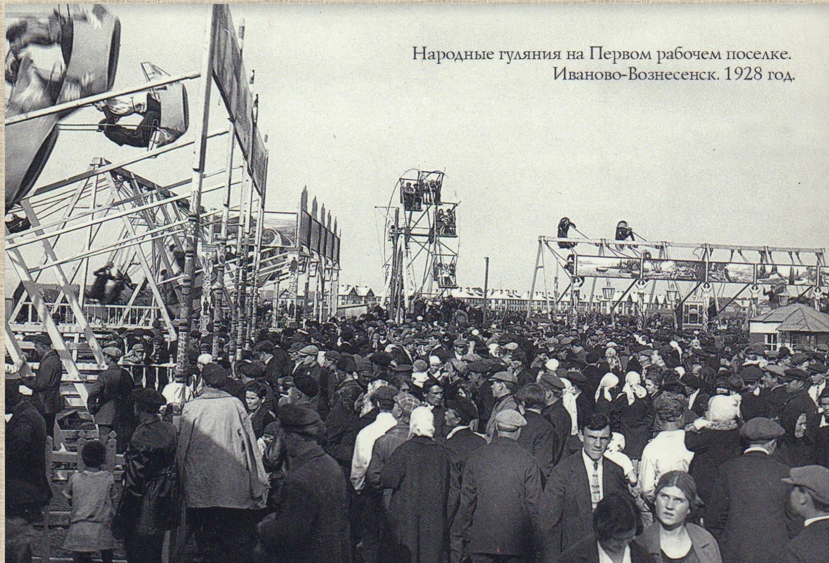
Народные гуляния на Первом рабочем поселке. Иваново-Вознесенск. 1928 год.