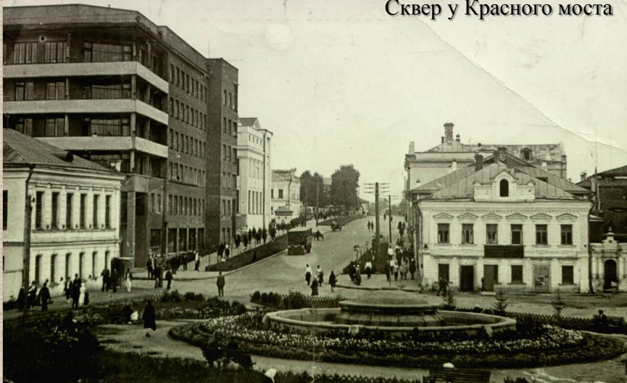
Сквер у Красного моста