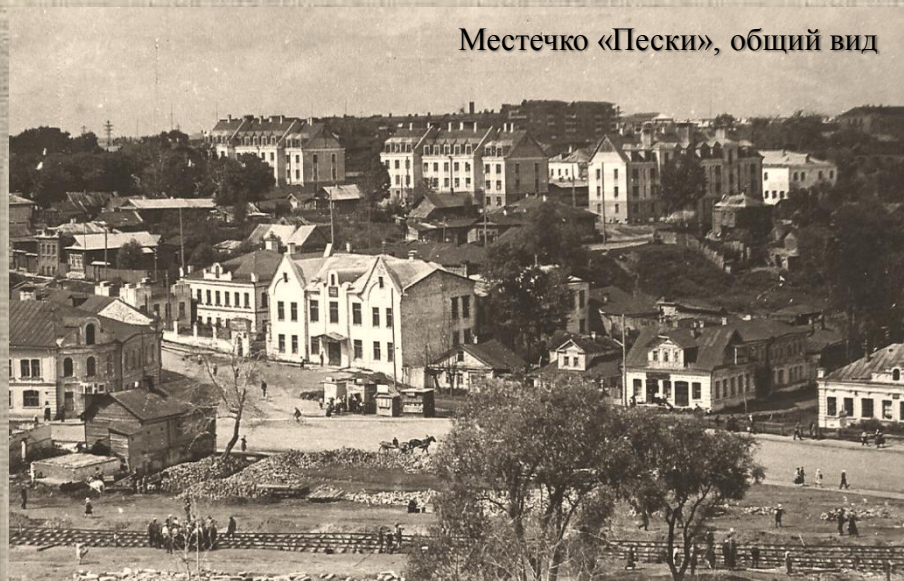
Местечко «Пески», общий вид