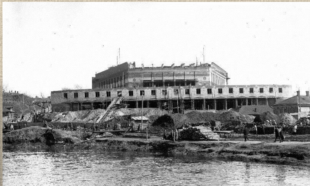
Фото с берега р. Увось Д.В. Садкова

Ход строительства здания Ивановского драматического театра и работы по благоустройству окружающей местности в 1935-1938 гг. Дворец был открыт в 1939 г. (Фото из открытого доступа)