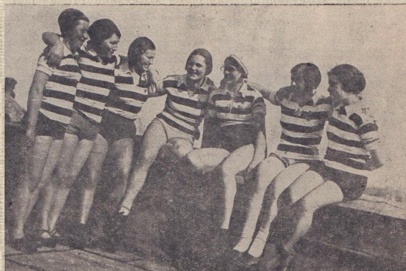
Группа работниц ф-ки им. Дзержинского на физкультурном отдыхе на крыше фабрики в перерывах между сменами