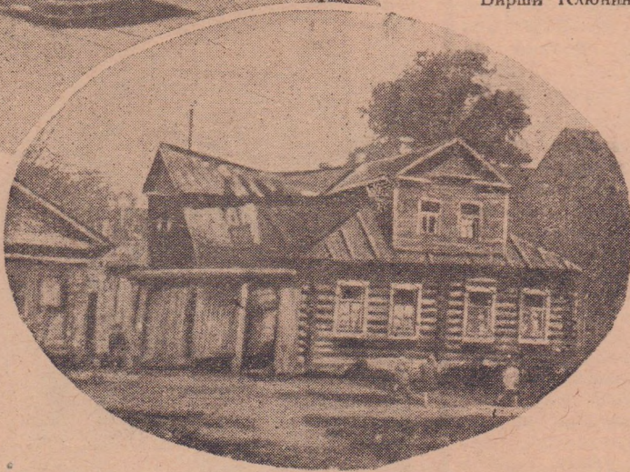
Старое и новое Иваново

Но, конечно, Иваново, как боярская вотчина XVII века, или, как крепостное торговое село XVIII столетия, не оставило бы большого следа в художественной литературе, — таких сел было много. Только быстрое развитие в нем текстильной промышленности со второй половины XVII века выдвинуло Иваново на одно из очень заметных мест в России.