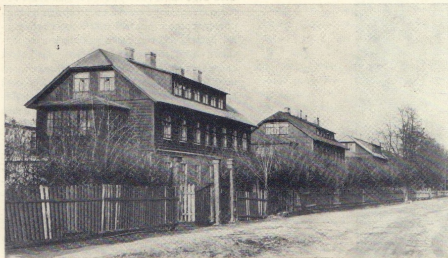
Дом во «Втором рабочем поселке», 1925 г.